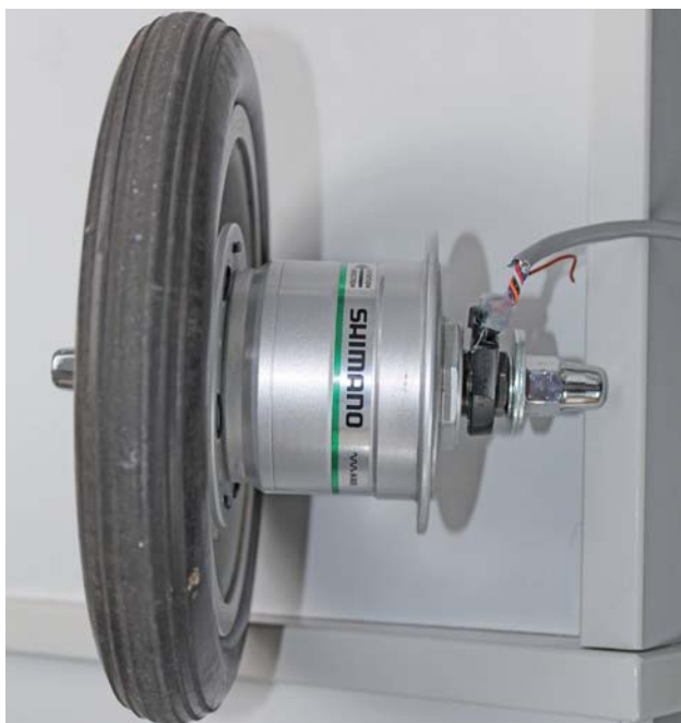
BILD 1: Nabendynamo der Firma SHIMANO (Typ DH-3N20) befestigt an einem kleinen Laufrad FIGURE 1: Dynamo hub manufactured by SHIMANO (type DH-3N20) mounted to a small carrying wheel

Damit die ermittelten Gehgeschwindigkeiten so realitätsnah wie möglich sind, durfte jeder Proband seinen eigenen Rollator für die Messung nutzen, da diese in der Regel exakt auf die Größe ihrer Besitzer eingestellt sind und sich der Proband so am sichersten fühlt. Daher wurde das Messrad an einer variabel