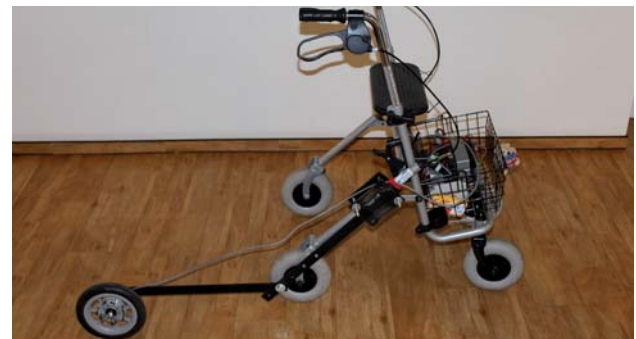
FIGURE 2: On almost any walking frame fortifiable metal rail with mounted measuring wheel